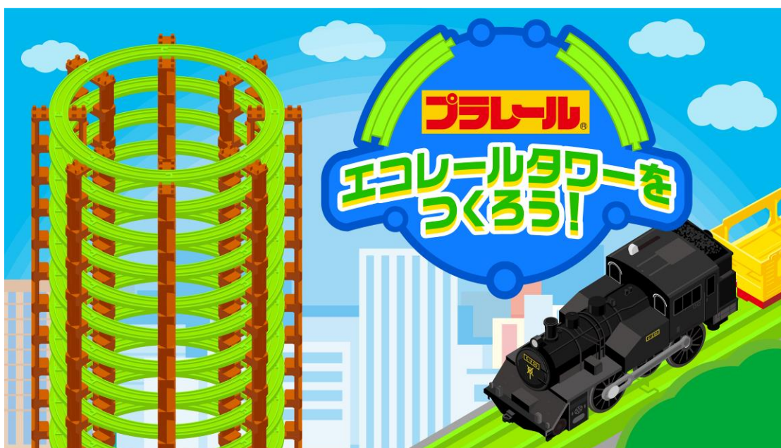
「プラレール エコレールタワーをつくろう！」 タイトル画面