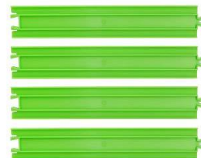
プラレール「エコ直線レール」 (希望小売価格:350円/税抜)

1959年から続くロングセラー鉄道玩具「プラレール」シリーズの「エコ直線レール」と「エコ曲線レール」は、レール部品の50%以上に再生材料を配合している商品で、これらを「エコレール」と呼んでいます。レールカラーはエコをイメージしたグリーンです(定番は青色)。2012年7月の発売に先駆けて、2012年6月、財団法人日本環境協会が実施するエコマーク認定制度において、エコマークを取得しました。それまで原料(再生材料)の安全性や品質確保等の課題から玩具分野では取得が難しいとされてきましたが、業界他社に先駆けて“おもちゃではじめて”のエコマーク取得となりました。